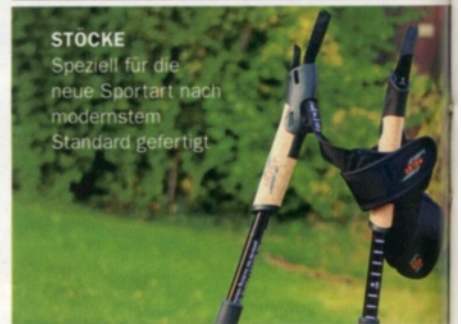
STÖCKE Speziell für die neue Sportart nach modernstem Standard gefertigt